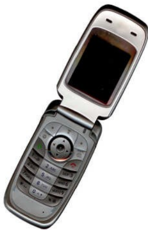
Fig. 3 Ejemplo de figura con buena resolución