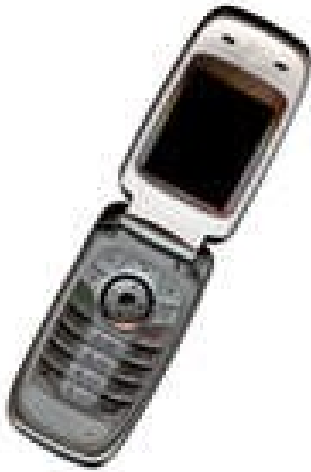
Fig. 2 Ejemplo de figura con baja resolución