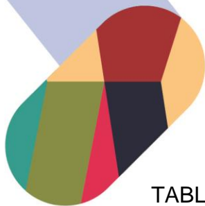
TABLA 1 (Continuación). Actividades de Seminarios y Trabajos de Investigación.