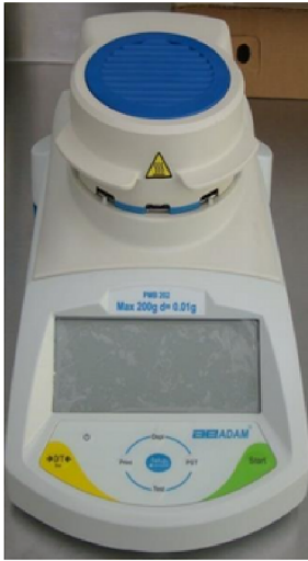
ANALIZADOR DE HUMEDAD