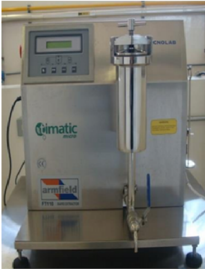
EXTRACTOR DE AROMAS