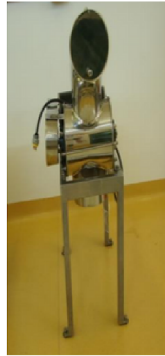
MOLINO DE MARTILLOS