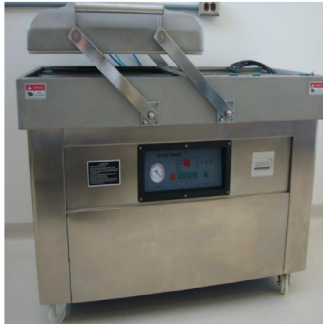
EMPACADORA AL VACÍO