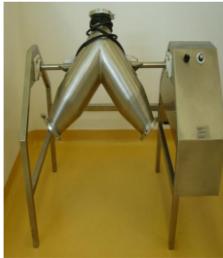
MEZCLADORA TIPO PANTALÓN