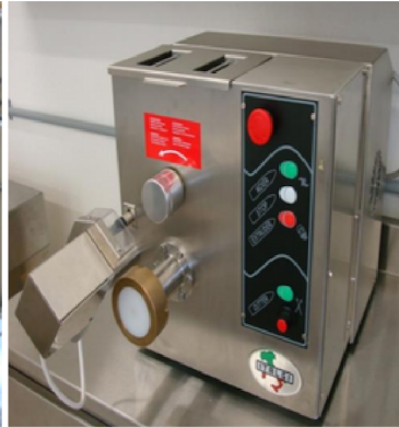
EXTRUSOR PARA PASTAS ALIMENTICIAS