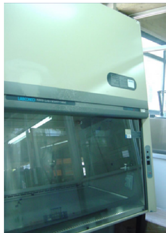
CAMPANA DE BIOSEGURIDAD