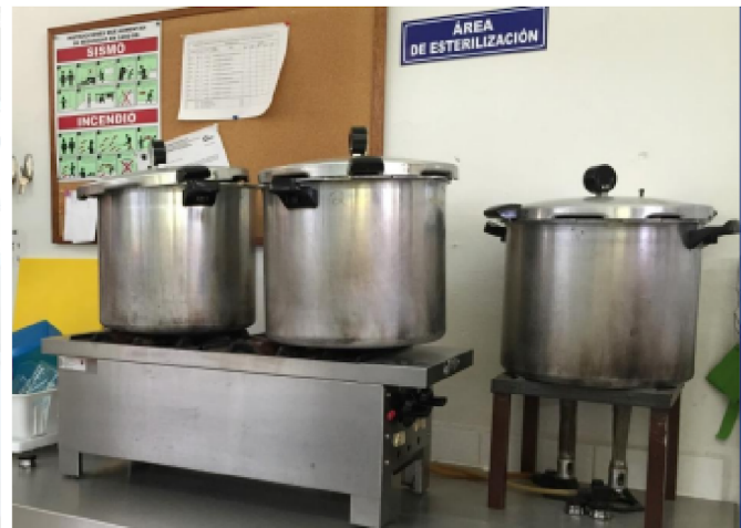
OLLAS DE PRESIÓN