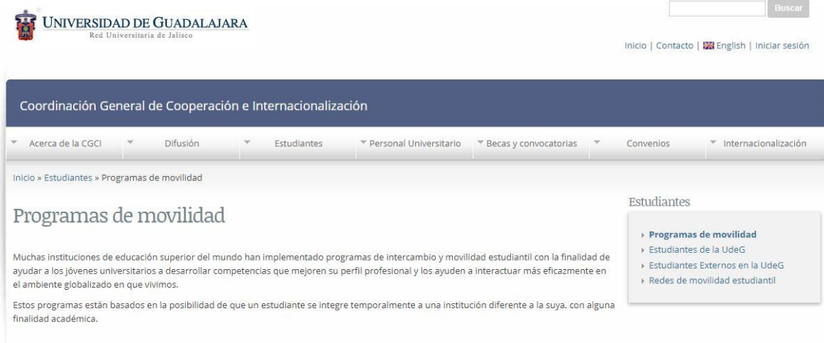
Figura 1. Página principal de internacionalización.

En la Universidad de Guadalajara existen diferentes mecanismos mediante los cuales se puede solicitar apoyo para llevar a cabo alguna acción de movilidad. La pagina principal se muestra en la figura 1 y se accesa a ella mediante la siguiente liga: http://www.cgci.udg.mx/es/estudiantes/programas_movilidad