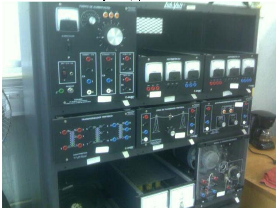
Fig. 56. Equipo Lab-Volt de prueba.