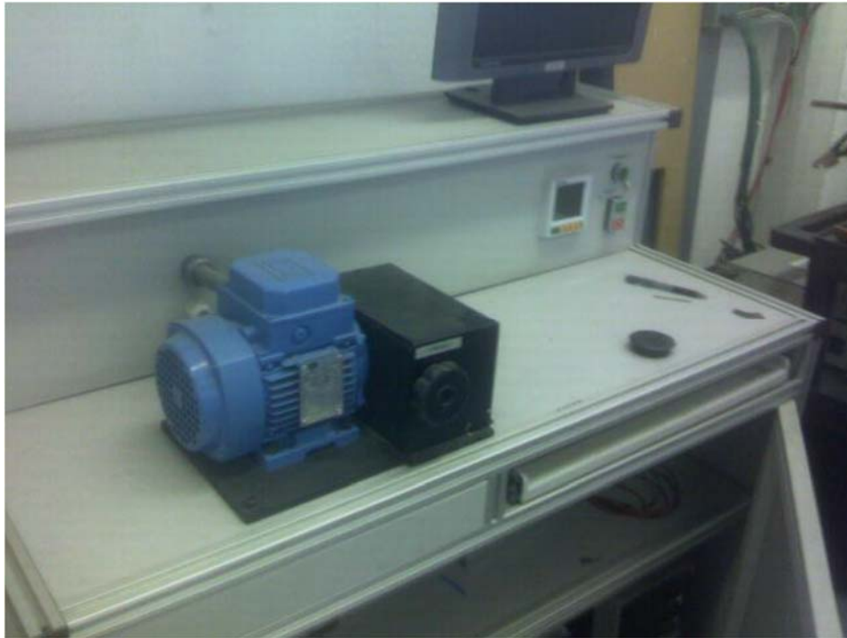
Fig. 59. Equipo de prueba de frenado/arranque.