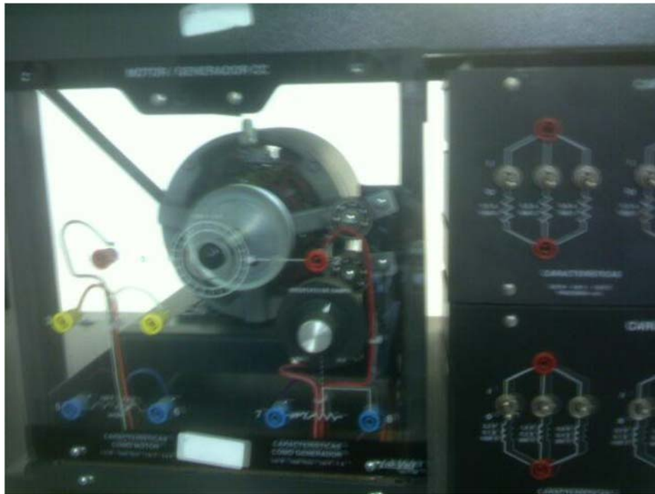
Fig. 57. Equipo Lab-Volt de prueba.