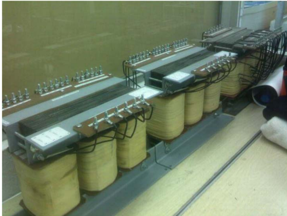
Fig. 55. Equipos diversos.