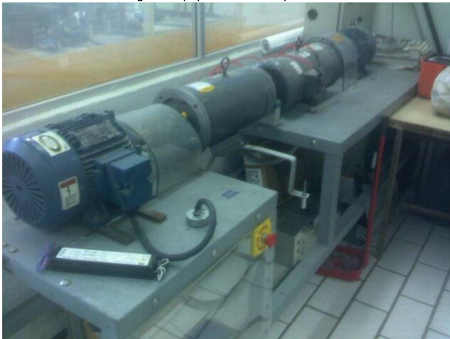
Fig. 58. Equipo de prueba de motores/generadores.