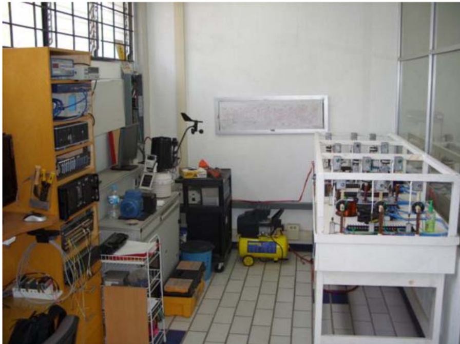
Fig. 52. Equipos varios.

Existen también en la institución diversas salas de cómputo para todos los estudiantes que cuentan con computadoras, impresoras y software.